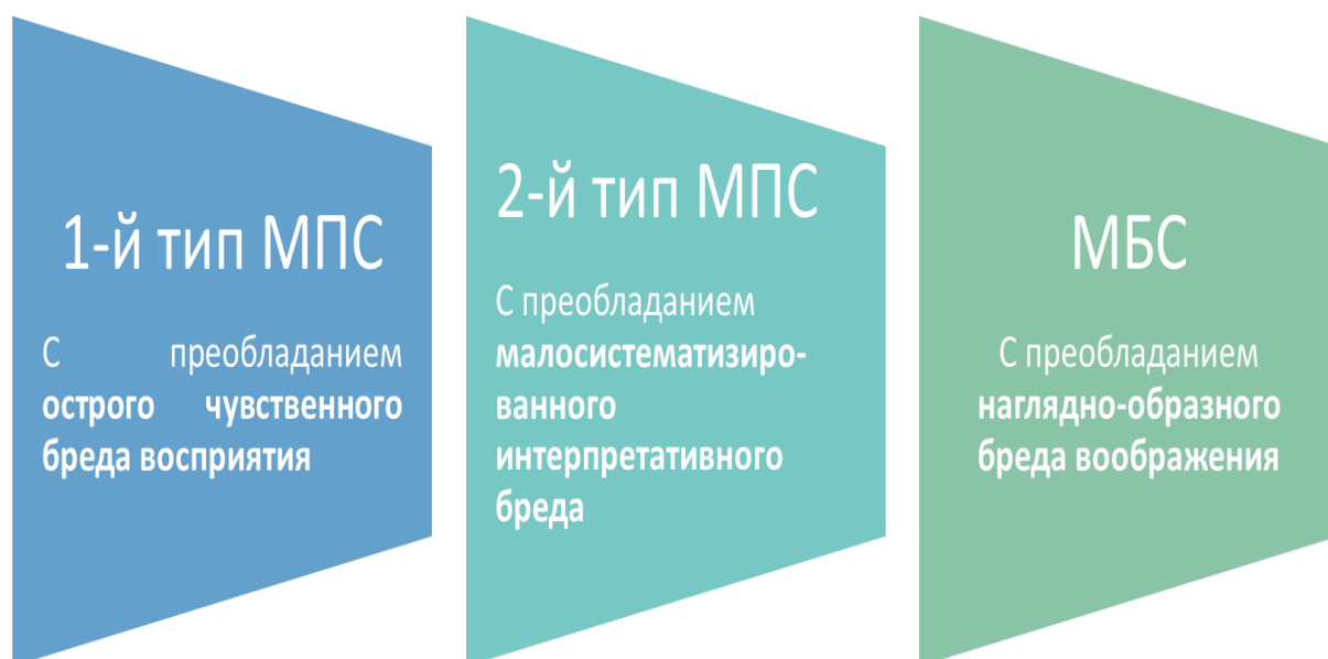
Рисунок № 1.

По психопатологическим особенностям бредовых расстройств, участвующих в формировании парафренного синдрома, была разработана типология маниакально-парафренных состояний. В картине синдрома особенности динамики собственно маниакальных расстройств и бредового компонента маниакально-парафренных состояний, находились в тесной взаимосвязи. Выделены 2 типа маниакально-парафренных состояний: